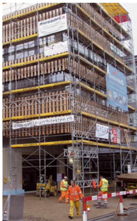
Neubau mit rund 40 Arbeitsplätzen...