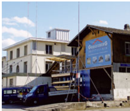
...wo vorher eine WG und ein Kunsthandwerk-Atelier einquartiert waren.

Das Neubauprojekt der Gygax Architekten AG musste die engen Platzverhältnisse berücksichtigen und die Vorgaben der Über-